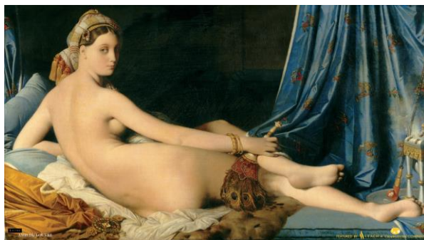
Décor visuel à partir de La Grande Odalisque d'Ingres , réalisé par Leach , filiale du groupe Chargeurs

Depuis 127 ans, Leach se positionne mondialement comme un créateur d'expériences visuelles innovantes à destination des musées. Basée au Royaume-Uni, la société a rejoint le Groupe en mai dernier, au sein du métier Chargeurs Technical Substrates. Elle compte dans son portfolio des institutions aussi prestigieuses que le Museum of London , le Royal Air Force Museum ou encore le National Charter Monument au Bahreïn.