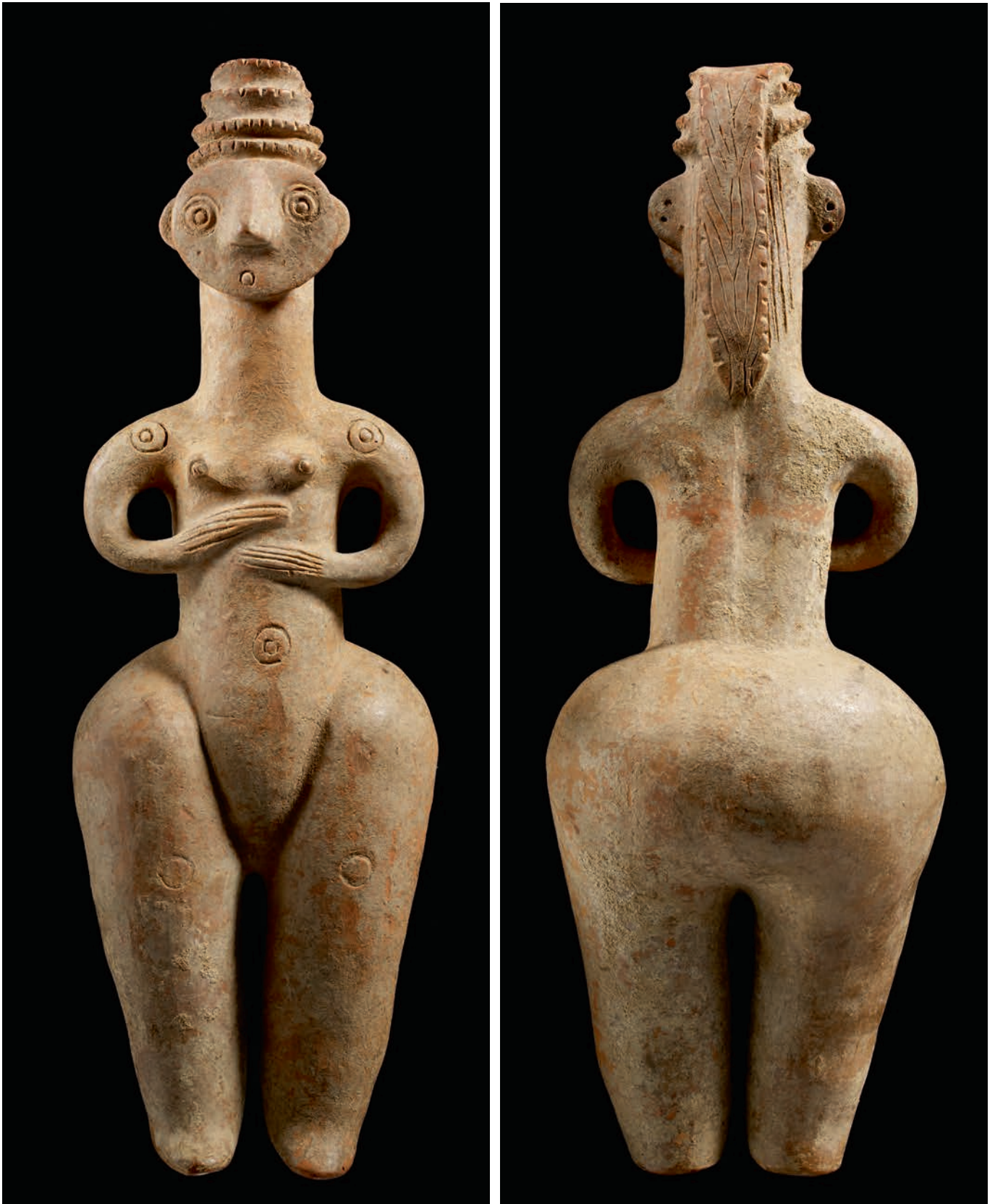
Statue féminine stéatopyge iranienne.

Iran (Kaluraz, dans la province de Gilan), début du Premier millénaire avant J.-C. Terre cuite lustrée, H. 46 cm.