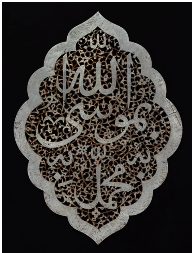
Iran (?), vers 1564 (?) Acier, décor ajouré 24 × 17,5 cm. Musée du Louvre, département des Arts de l'Islam, MAO 2249.

Les plaques à décor ajouré pouvaient servir de décor de porte, mais le très petit nombre de portes conservées ne permet pas d'être sûr de la disposition de ces dernières. On ne peut cependant exclure que certaines d'entre elles aient également servi de partie d'étendard de procession ( 'alam ) 2 . Si l'emploi des 'alam , au moment des processions