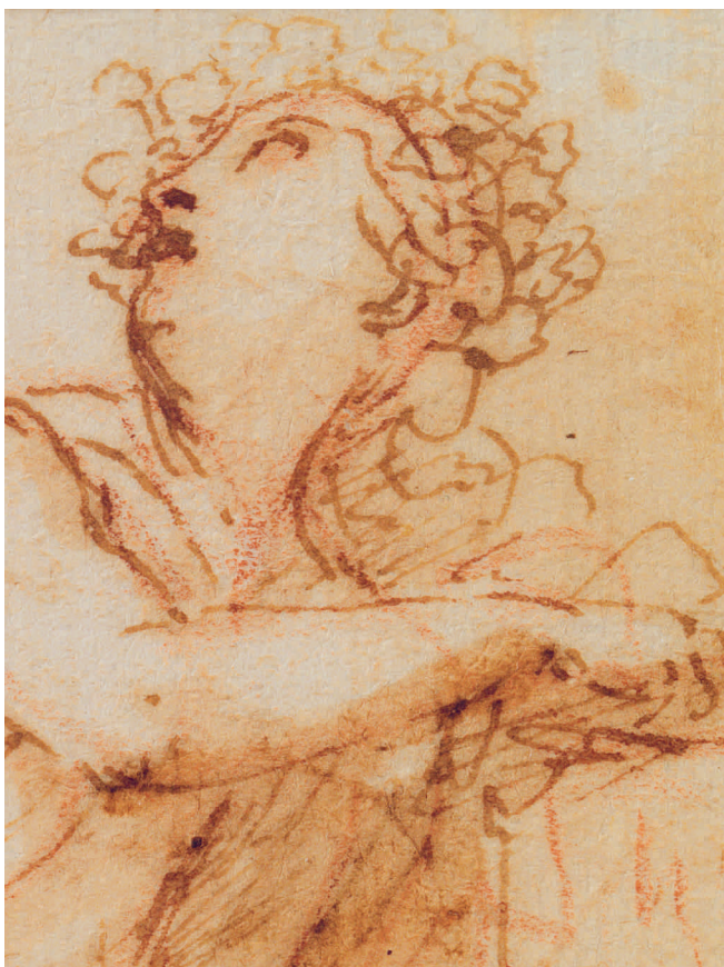
Giovanni Baglione (1573 - 1644), Rome. Etude pour Thalie. Muse de la Comédie, H.11,9 cm ; L. 9,8 cm. Sanguine, plume et encre brune, lavis brun.