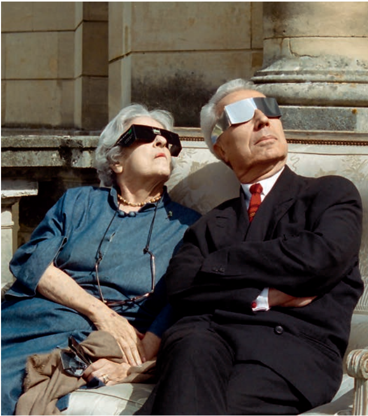
Liliane de Rothschild et Marc Fumaroli à Royaumont lors de l'éclipse de soleil de 1989.