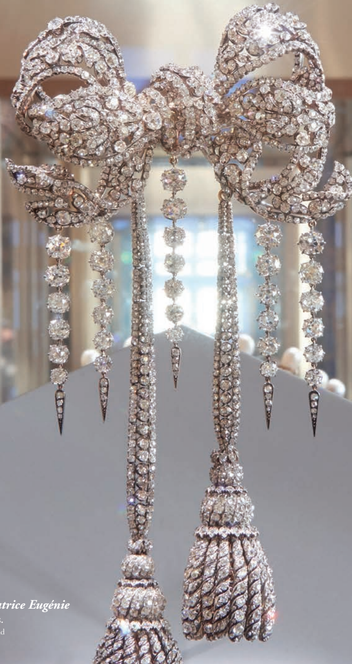
Grand nœud de corsage de l'Impératrice Eugénie Galerie d'Apollon, Musée du Louvre, Paris. François Kramer. Diamants, 1855.