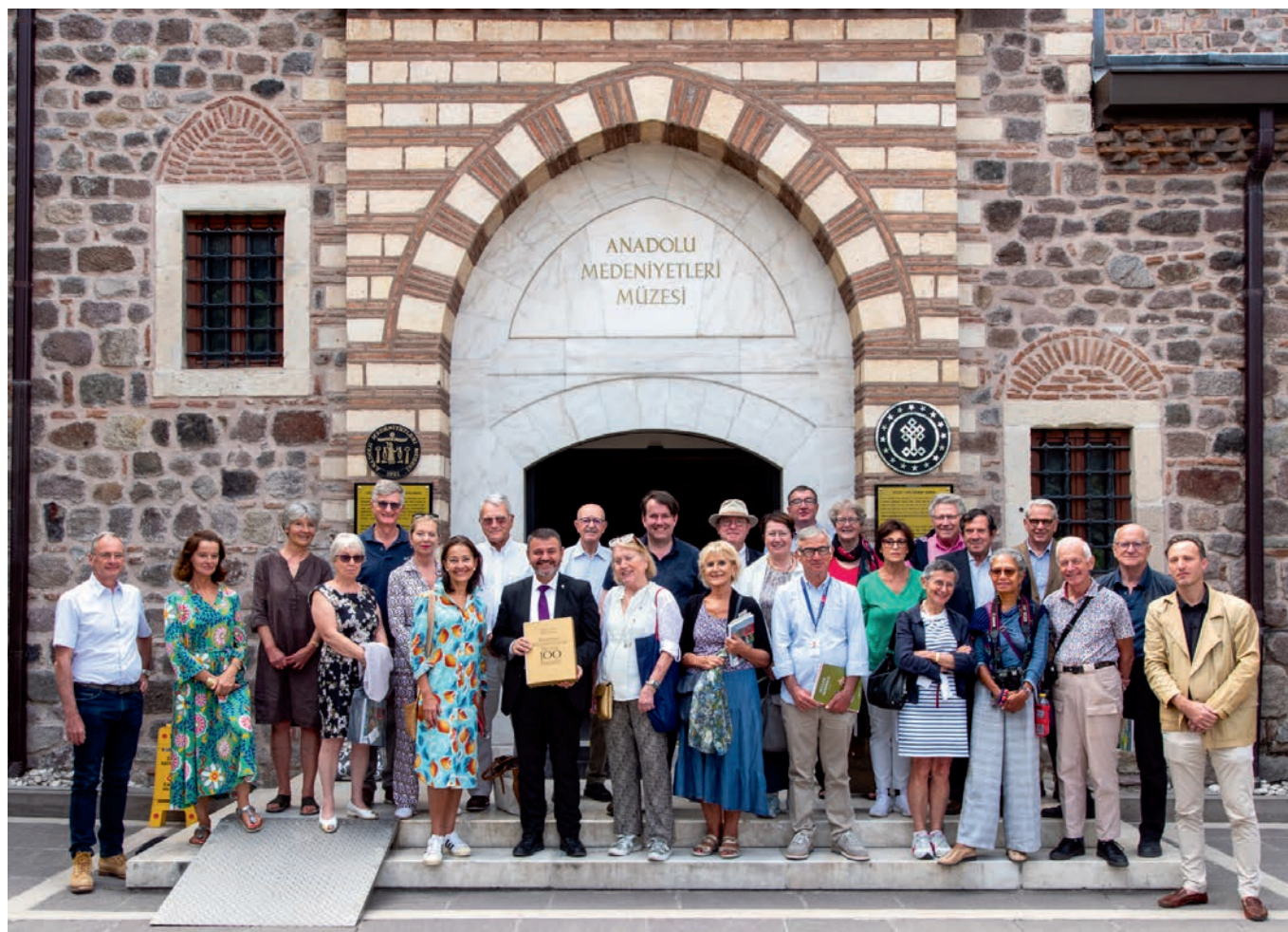
Les Amis du Louvre devant le musée des civilisations anatolienne d'Ankara avec son directeur.