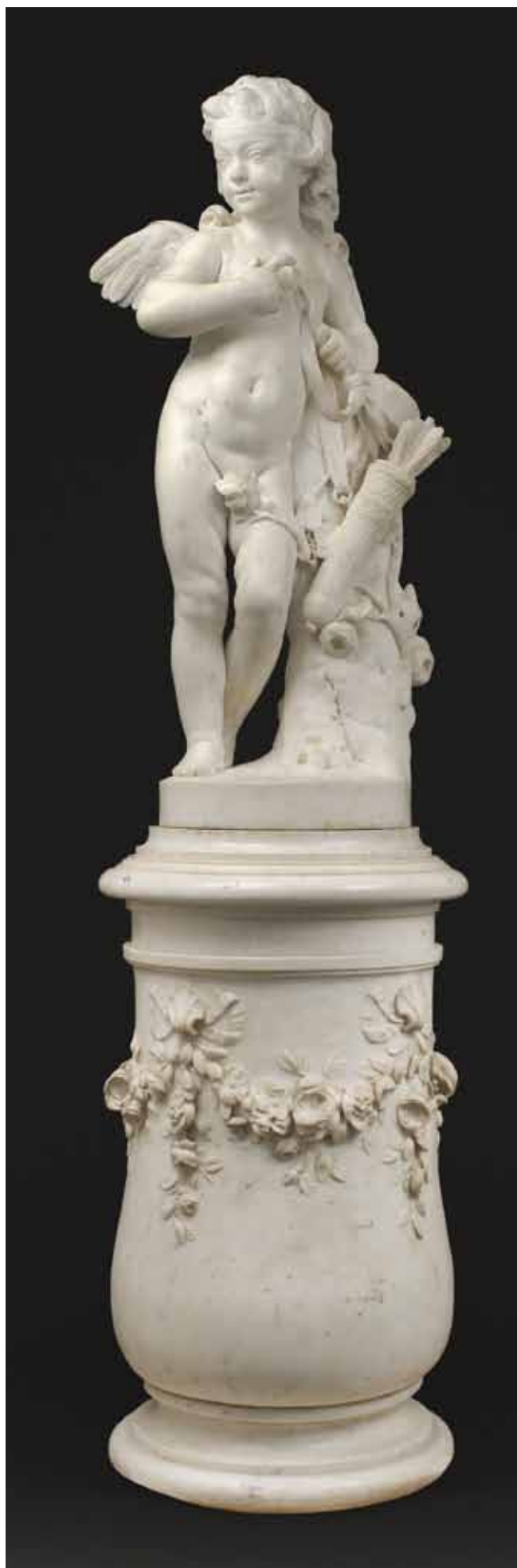
L'Amour essayant une de ses flèches. Jacques Saly, 1753.

Par Guilhem Scherf Conservateur en chef au département des Sculptures