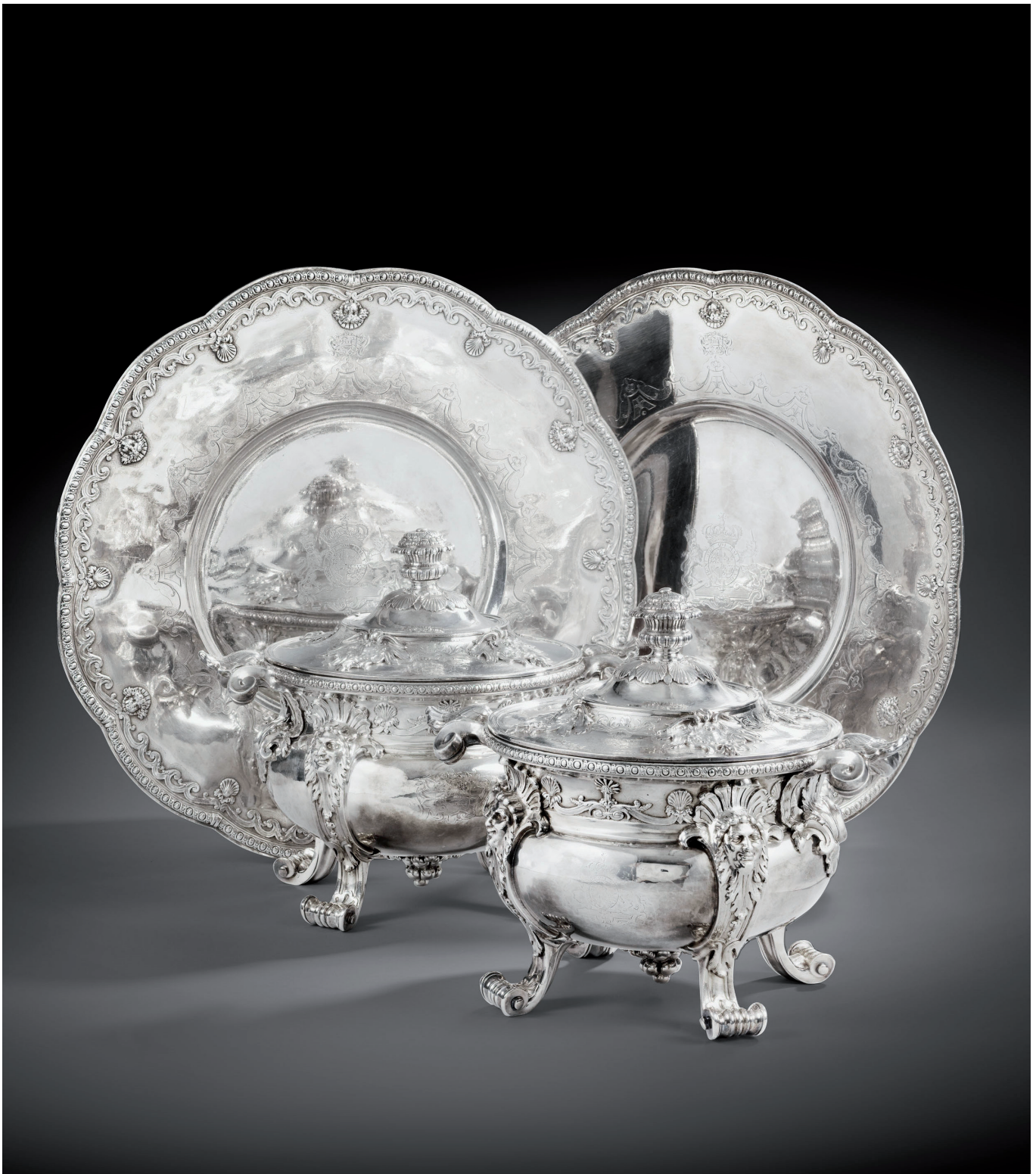
Nicolas Besnier, orfèvre du Roi (1686-1754). Deux pots à huile du Service Walpole et leur plateaux. Argent fondu, ciselé et gravé. Poinçons de Nicolas Besnier et de Paris pour l'année 1726-1727. H. 38 cm; D. des plateaux 45 cm; poids total: 16,6 kg. Aux armes de George I er d'Angleterre (1714-1727) et d'Horace Walpole (1678-1757), ambassadeur d'Angleterre en France de 1723 à 1730. Paris, Musée du Louvre. Département des Objets d'art. Classé Trésor National le 10 juillet 2013.

Ces magnifiques témoins de l'orfèvrerie parisienne du premier XVIII e siècle, très rarement exposés et publiés, étaient jusqu'ici sans équivalent dans les musées français dont les collections d'orfèvrerie ne s'étoffent qu'après les années 1730 avec les premiers éléments du service Penthièvre-Orléans,