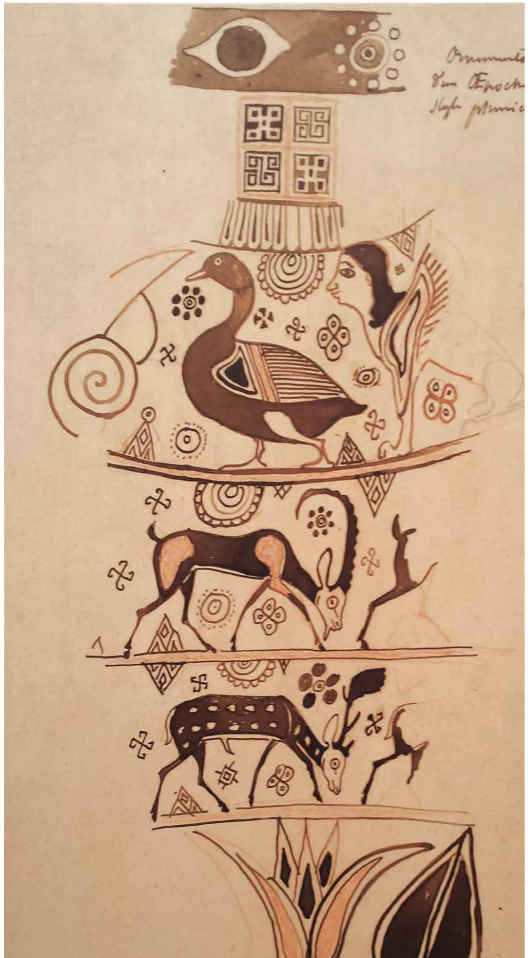
Fig. 2. (page de gauche) Lithophotographie du même vase.