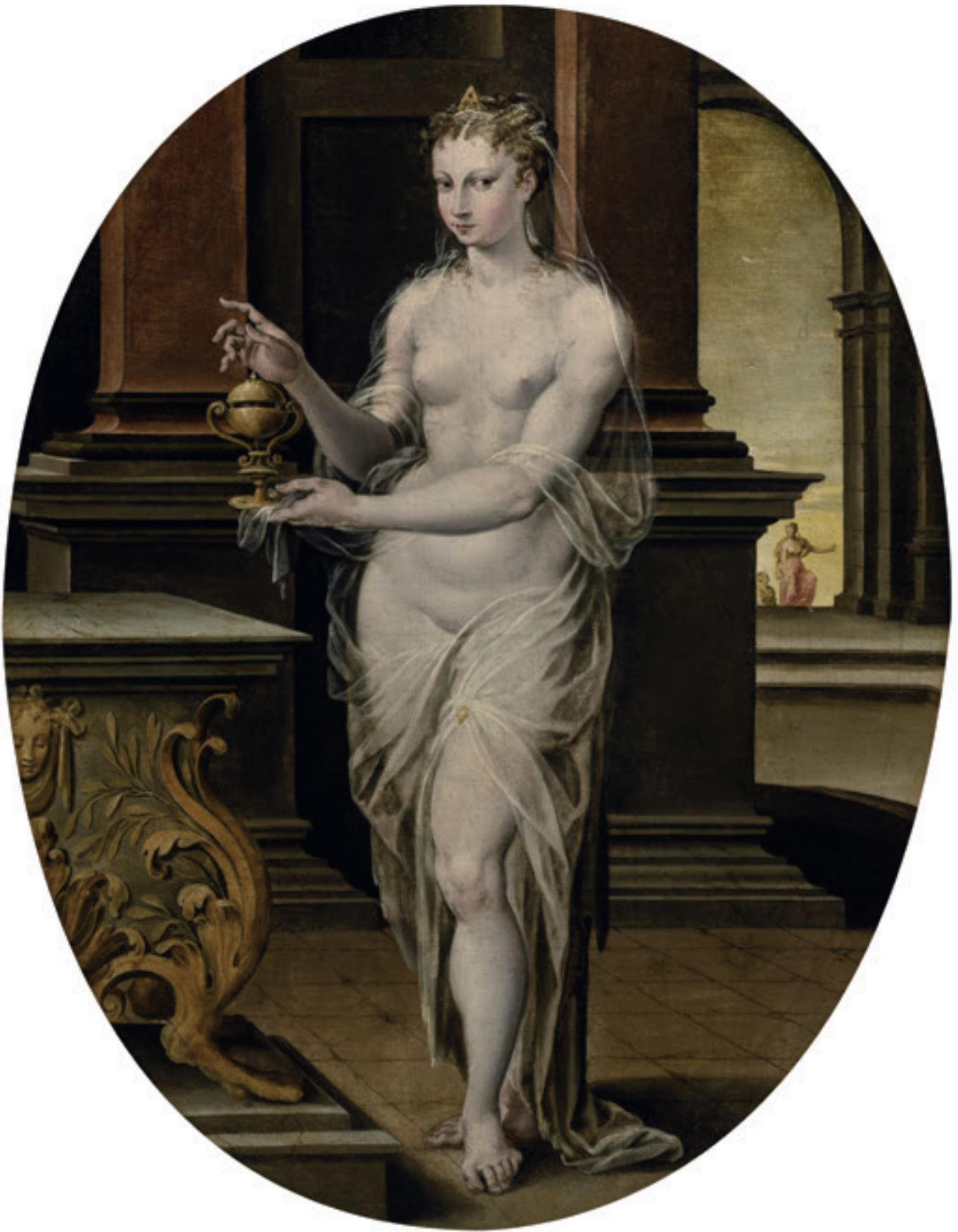
Pandore. Niccolò dell'Abate, vers 1555.