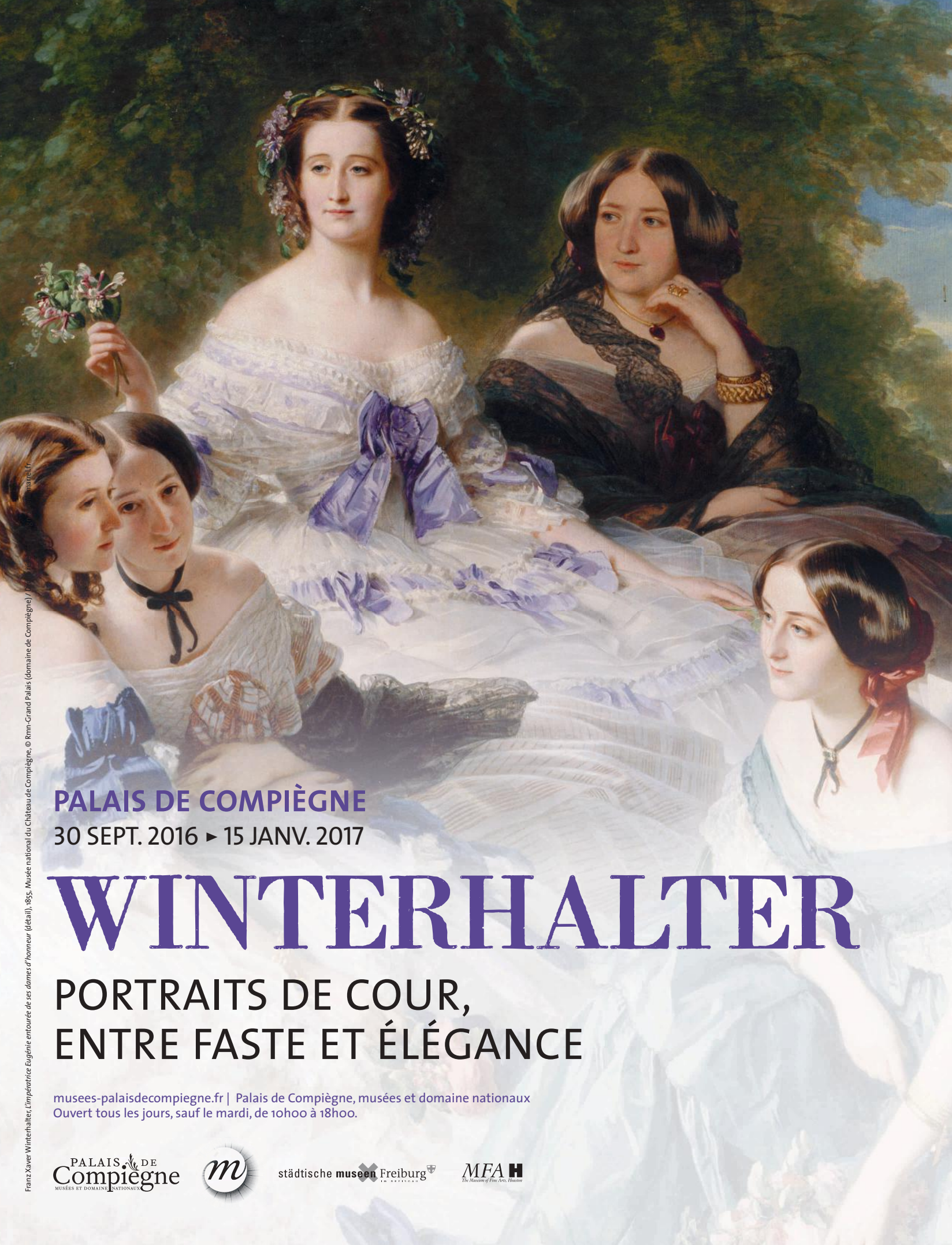
Franz Xaver Winterhalter, L'impératrice Eugénie entourée de ses dames d'honneur (détail), 1855. Musée national du Château de Compiègne

PALAIS DE COMPIÈGNE 30 SEPT. 2016 ▶ 15 JANV. 2017