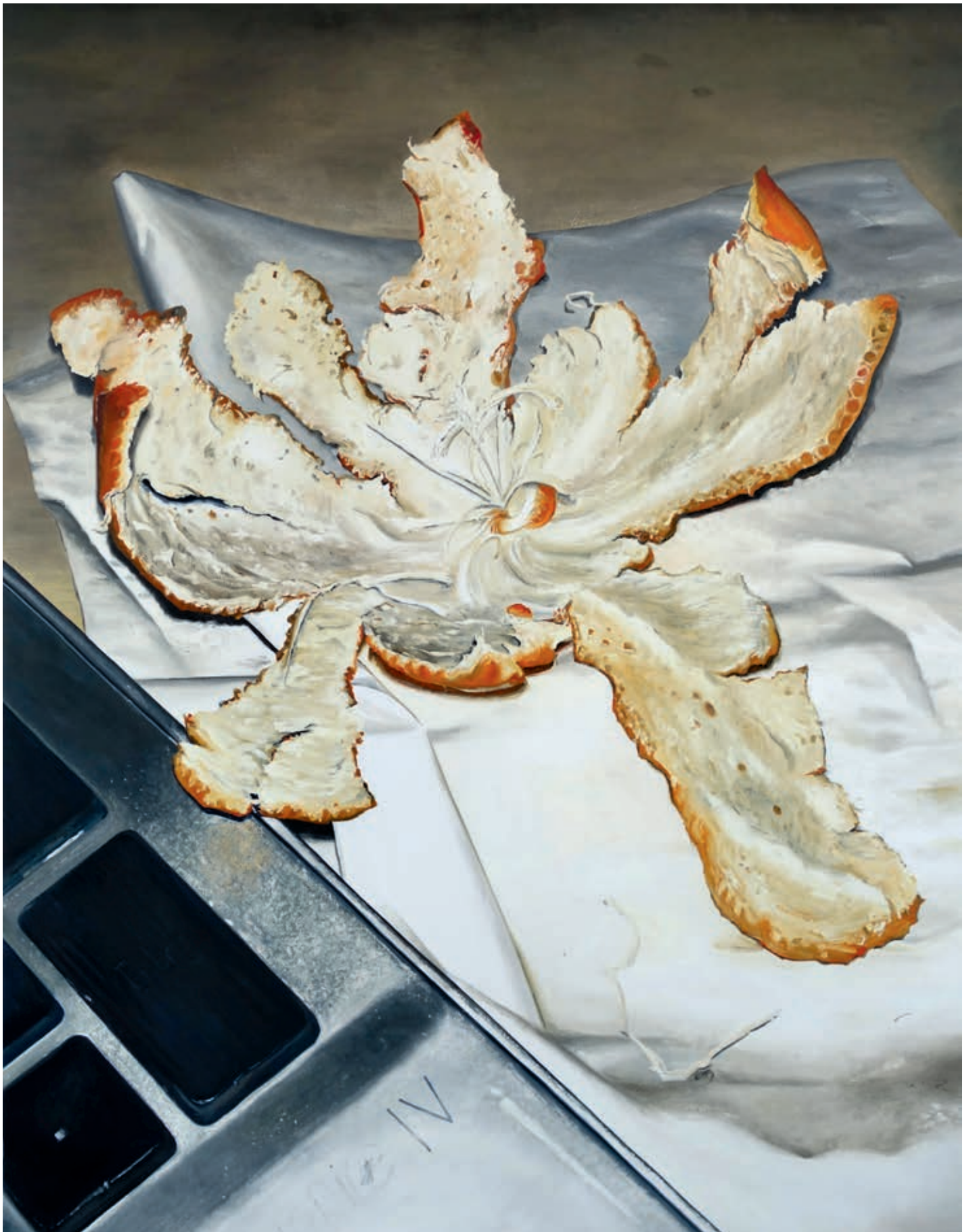
Peau , 2021, Mireille Blanc