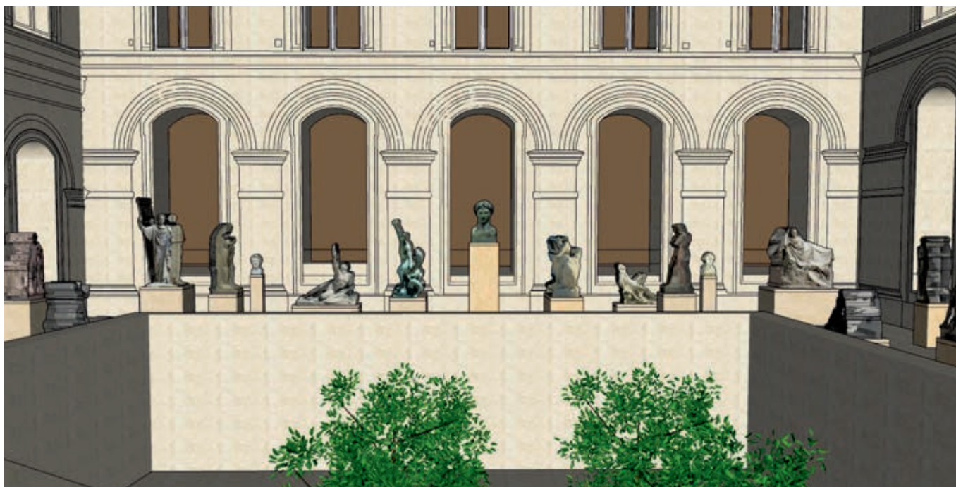
Vue 3D du projet de nouvelle présentation de la Cour Puget

Par Stéphanie Deschamps-Tan , Conservatrice en chef au département des Sculptures