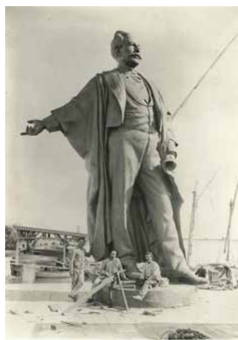
Pose de Ferdinand de Lesseps montage provisoire de la statue sur l'apportement du magasin 1899, tirage photographique. Souvenir de Ferdinand de Lesseps et du canal de Suez, Paris.

À l'occasion de l'ouverture prochaine du nouveau musée égyptien du canal de Suez à Ismaïlia, se révèle le patrimoine architectural et artistique de la plus grande aventure industrielle du XIX e siècle.