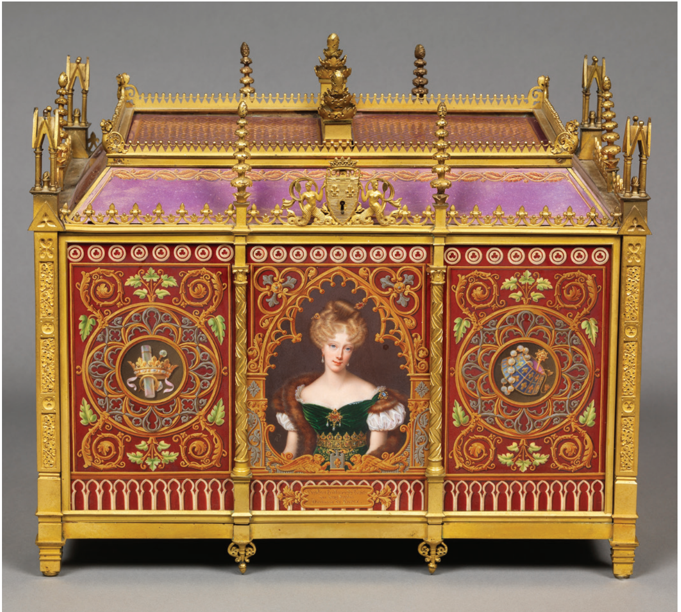
Manufacture de Sèvres. Coffret à bijoux de la duchesse de Berry 1829. Porcelaine dure, bronze doré. Coll. musée du Louvre, Paris.