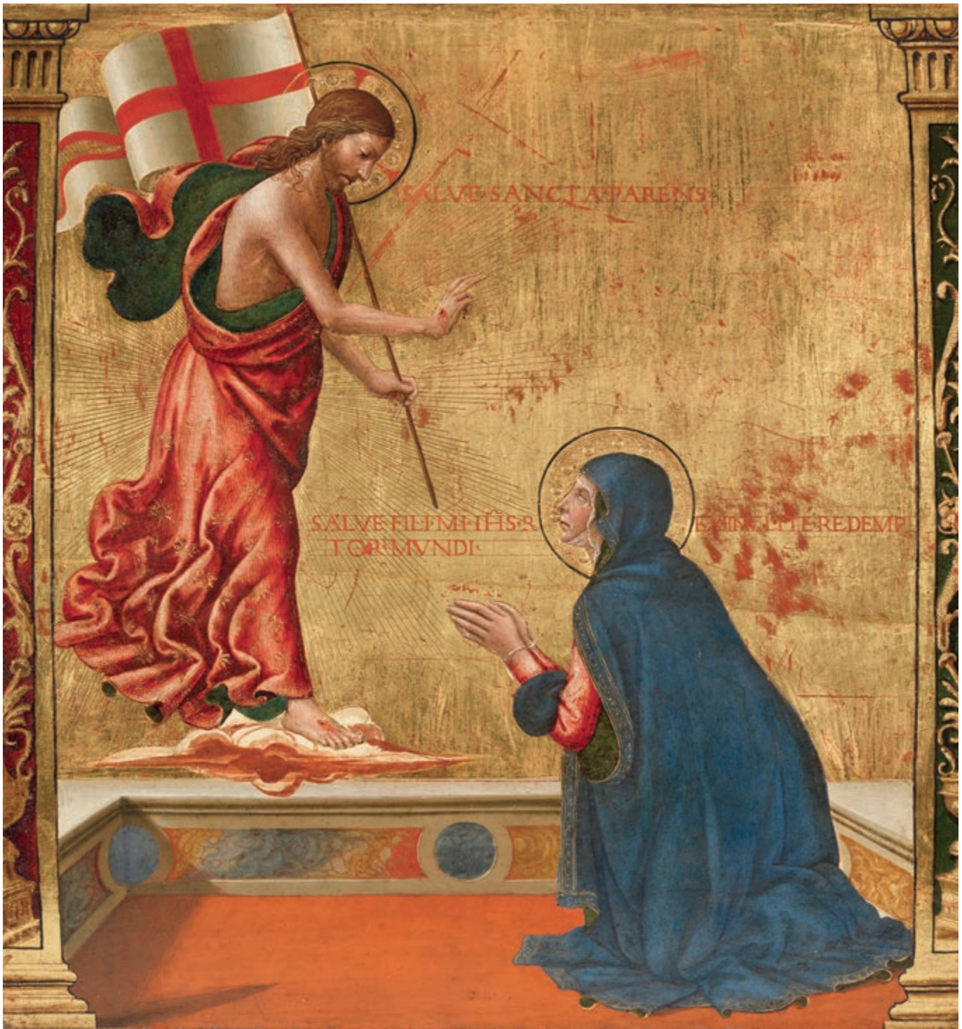
Domenico Ghirlandaio (1449-1494) L'Apparition du Christ ressuscité à la Vierge