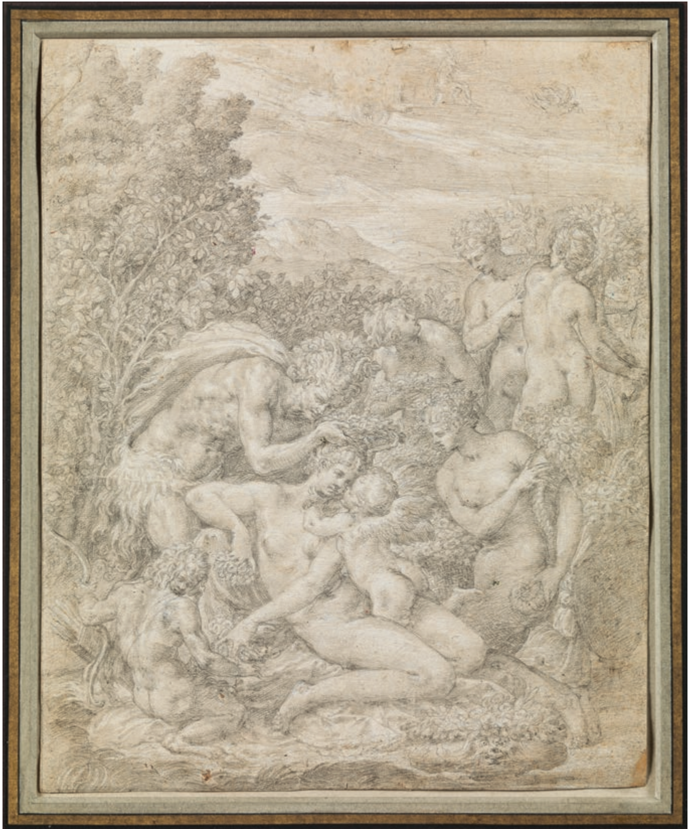
Maître de Flore (actif à partir de 1550 environ) Vénus couronnée par un satyre, l'Amour et les trois Grâces

Vers 1557-1570, pierre noire, rehauts de gouache blanche, papier beige, H. 29 cm ; L. 23,5 cm Coll. musée du Louvre, Paris. Don de la Société des Amis du Louvre