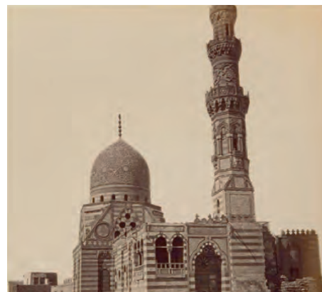
Tombeau des Sultans d'Égypte et de Syrie Kaït Baït, Le Caire, photographie par FÉLIX BONFILS en 1878, dans Souvenirs d'Orient

Rares sont les institutions européennes ou américaines à consentir des prêts à des musées égyptiens. C'est la force du Louvre que de porter des collaborations fortes et audacieuses. En 2018, l'exposition « Le Louvre à Téhéran », présentée au musée national de Téhéran, avait connu un retentissement considérable en Iran et avait été un véritable succès populaire. Le projet d'exposition porté par le département des arts de l'Islam participe de cette même volonté d'amener le Louvre partout où il a des admirateurs.