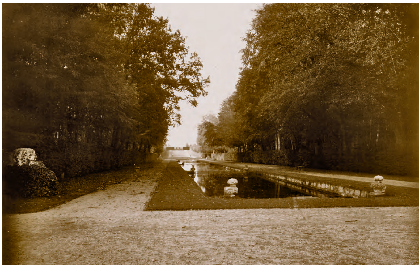
Nappes d'eau, Parc du château de Courances, Fonds Duchêne