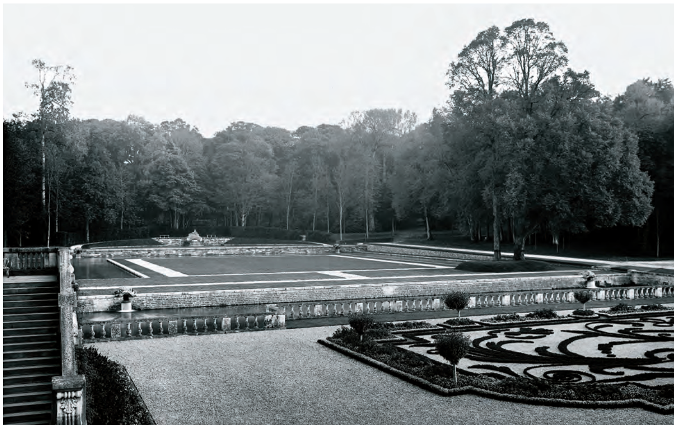
Bassin de la Baigneuse et parterre français, Parc du Château de Courances, Fonds Duchêne