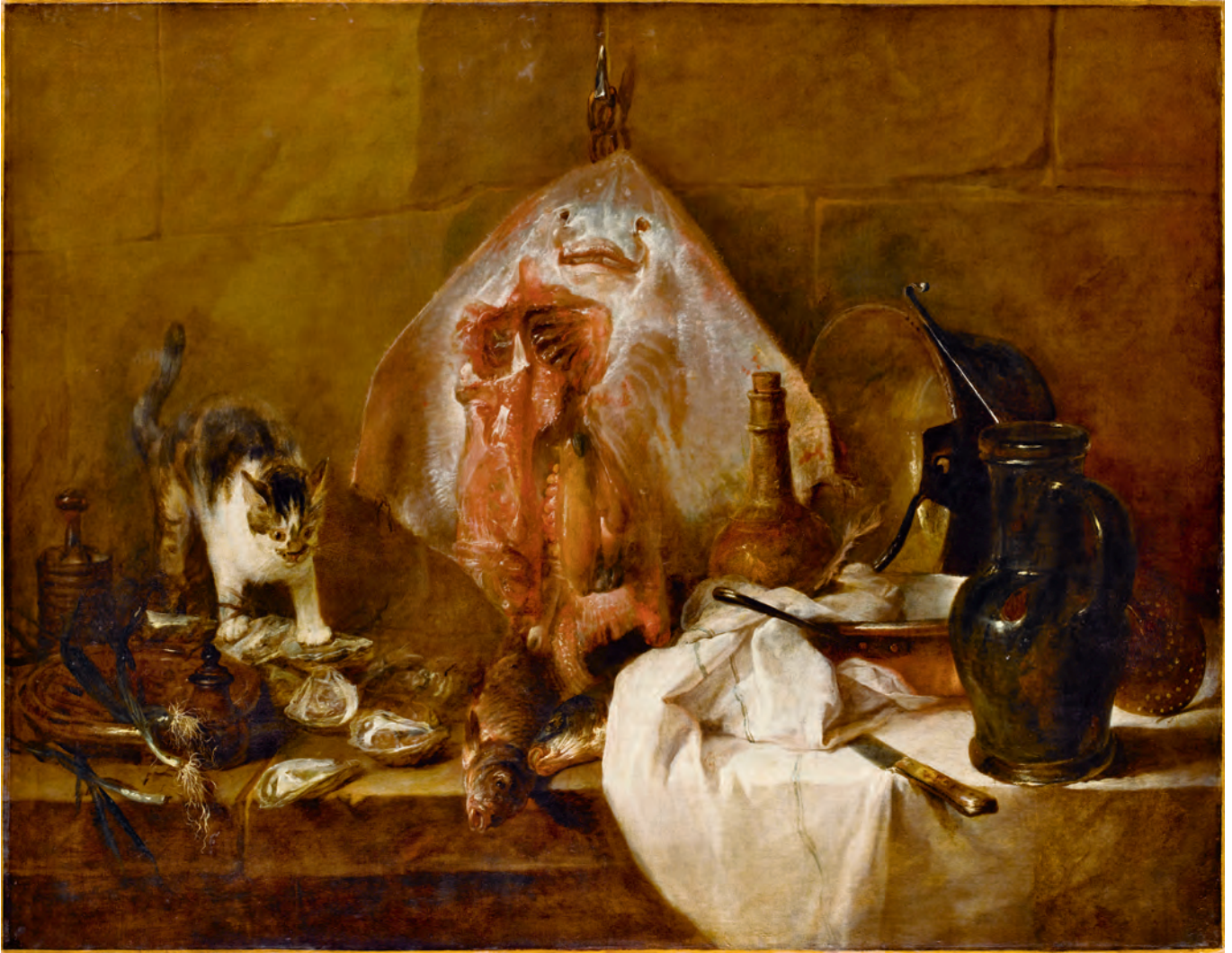
La Raie CHARDIN vers 1725-1726, huile sur toile, 114 × 146 cm, Paris, musée du Louvre