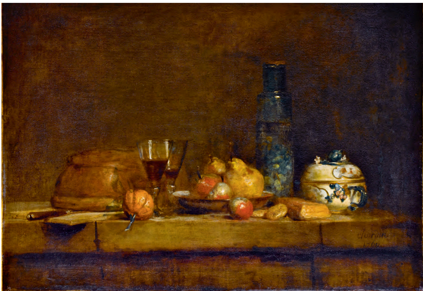
Le Bocal d'olives

spectateur, de le hanter parfois. Décidément peu disert sur sa praxis, ayant claqué la porte de son atelier au nez des confrères et à celui des profanes, il souhaita évidemment tenir à distance les amateurs comme de possibles concurrents. Il rompait en cela avec la fonction la plus traditionnelle de l'atelier, tout à la fois lieu de sociabilité, d'exercice de l'art, de commerce, de passation de commandes et, enfin, d'enseignement. On sait que les contemporains évoquèrent volontiers la « magie » à propos de la manière mystérieuse qu'avait sa peinture d'opérer sur le spectateur. Le magicien se garda bien de révéler ses tours. L'eut-il fait, en aurions-nous mieux saisi les arcanes ? La perspicacité de la science et la capacité d'investigation pénétrante de la chimie ont permis d'appréhender les pratiques empiriques, assez singulières parfois, d'un peintre qui témoigne d'un soin constant dans toutes les étapes de la préparation pour donner in fine toute latitude à une sorte de fougue picturale. La première étape était la composition de sa palette et le choix – tout indique qu'il fut extrêmement